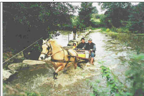
La randonnée en attelage, une plaisir à partager en famille avec nos bons « gros »

1500 pratiquants. Les contacts que nous avons actuellement de toute la France, nous permettent d'envisager une évolution optimiste en 2009.